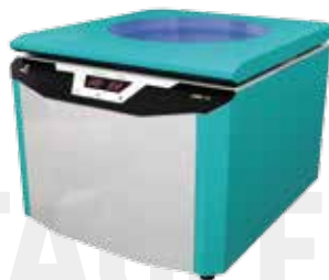
Центрифуга лабораторная молочная с подогревом ТАГЛЕР модель ЦЛМН 1-8