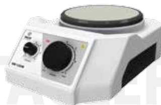
Мешалка магнитная ТАГЛЕР ММ-135НМ