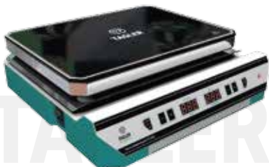
Плита нагревательная ТАГЛЕР ПН - 4030СК