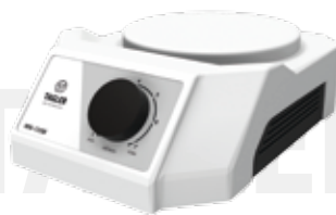
Мешалка магнитная ТАГЛЕР ММ-135М