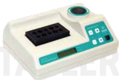
Термостат ТАГЛЕР для пробирок модель НТ- Plasmolifting Gel