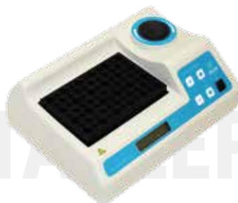
Термостат ТАГЛЕР для пробирок модель НТ-120