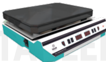
Плита нагревательная ТАГЛЕР ПН - 4030